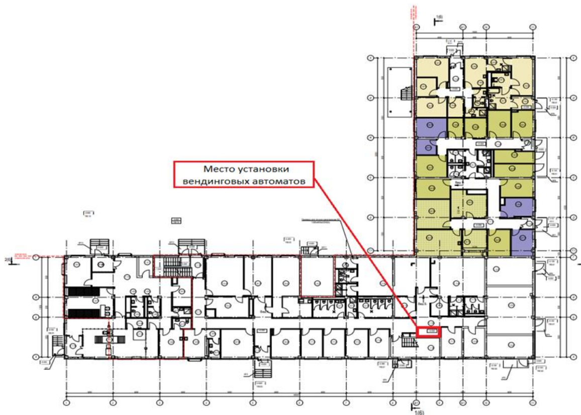
Схема размещения 1 этаж здания ТХЗ (код зоны объекта V.7)

В случае заинтересованности потенциальному партнеру необходимо заполнить Заявку на выражение заинтересованности (Приложение 3), соглашение о конфиденциальности (Приложение 1), а также предоставить уставные документы и коммерческое предложение по форме Приложения 4.