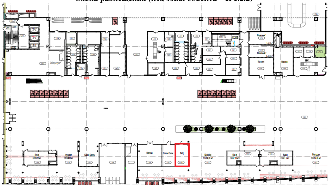
Схема размещения (код зоны объекта – R 1.2.2)

В случае заинтересованности потенциальному партнёру необходимо заполнить Заявку на выражение заинтересованности (Приложение 3), соглашение о конфиденциальности